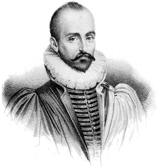
Michel de Montaigne

THE SAME IS IS FOR TWO HAIRS OR SEEDS TOO. THE MOST UNIVERSAL QUALITY IS DIVERSITY. ( Michel de Montaigne)